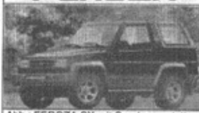
Abb.: FEROZA SX mit Sonderausstattung